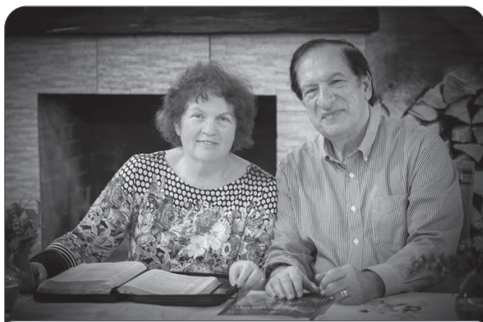
Мия и Костел Огличе

в Божьем винограднике. Один из учеников назвал их батарейками «Дюрасел», которые, согласно известной рекламе, никогда не устают. Но, к сожалению, это не так. Устают. Да еще как! Но у верующих есть «блок питания», «розетка», к которой всегда можно подключиться для «подзарядки»: