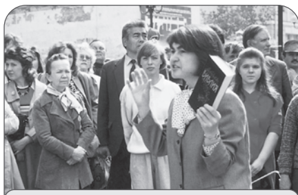
Проповедь Евангелия на Арбате

— Библия учит вести правильный образ жизни и проповедовать Евангелие.