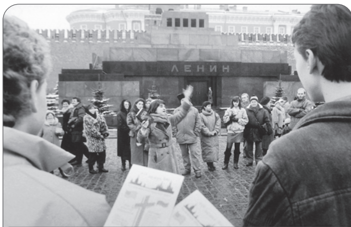
Проповедь Евангелия у Мавзолея Ленина

Через год после путча, в 1992-м, в Москве состоялось большое евангелизационное служение с участием самого известного благовестника XX века — Билли Грэма. Это было в спорткомплексе «Олимпийский», где мне выпала честь свидетельствовать о Христе. За три дня эти мероприятия посетили свыше 150 000 человек, что послужило образованию более тридцати церквей в Москве. Фантастическое время!