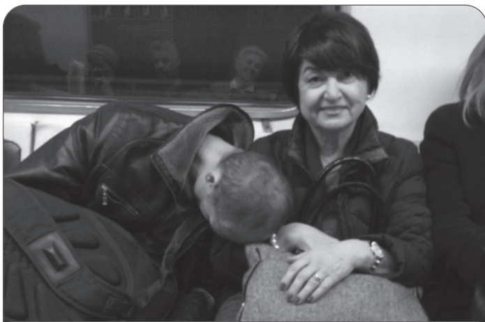
В московском метро

Еду на конференцию. Ветка в метро длинная, минут 30 колесить. Рядом со мной мужик сидит, хорошо поддатый. Глаза закрыты, голова то и дело запрокидывается в разные стороны — то назад, то набок. Бедная черепушка все ищет себе опору, где бы ей притулиться да куда бы себя, несчастную, положить-то, чтобы не дергаться. Гляжу — ко мне, родненькая, клонится. Все ниже и ниже, да и улеглась на моей груди. Хорошо ей сразу стало. Притомилась, голубушка. Как улеглась, ушла тут же в нирвану... С горячительным перебрала явно.